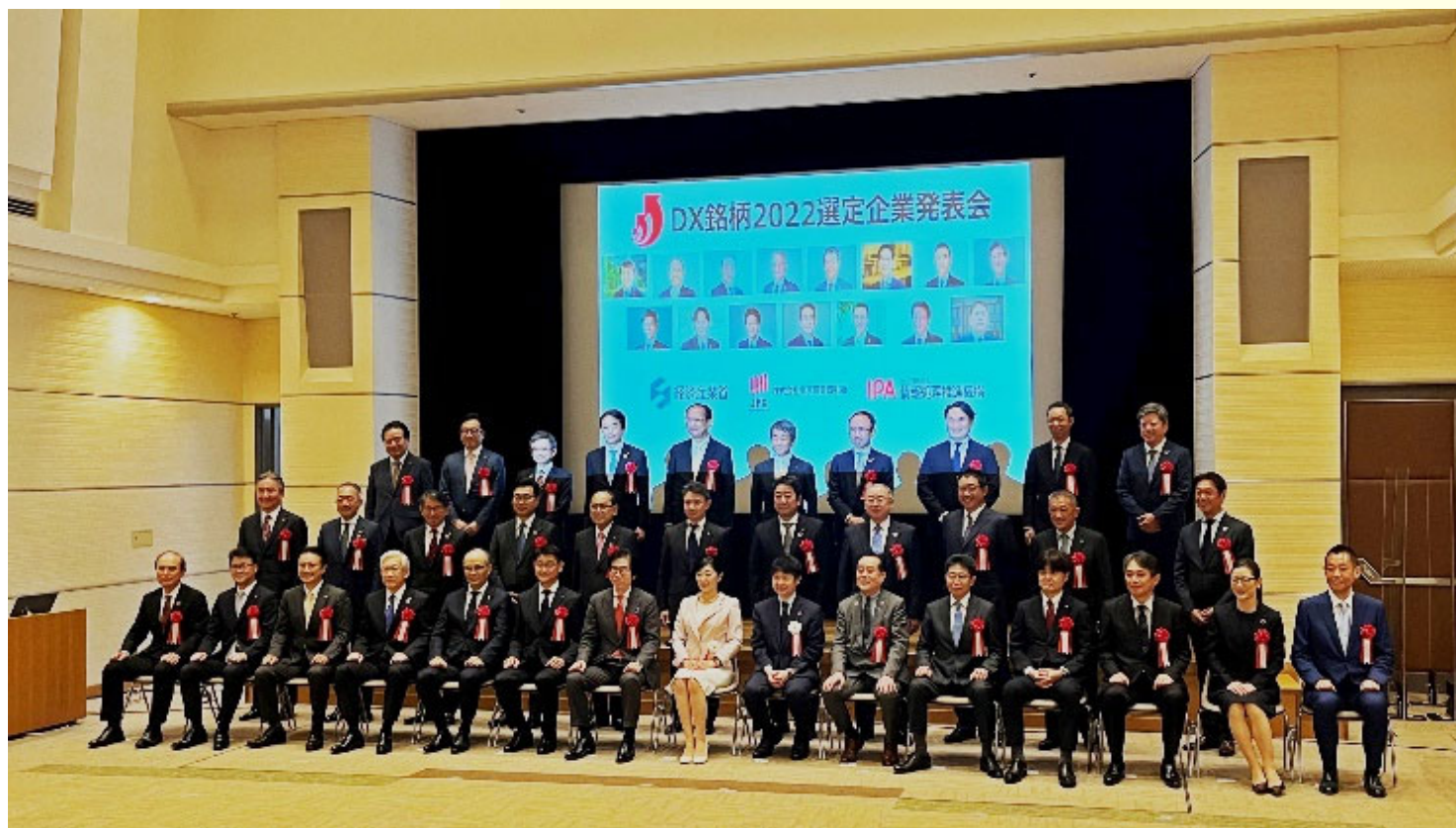
東京証券取引所で開催された「DX銘柄 2022 選定企業発表会」の様子