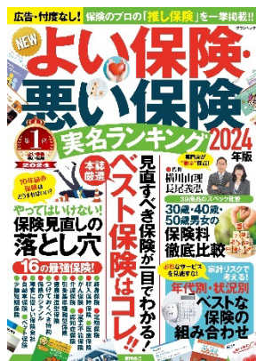
『NEW よい保険・悪い保険 2024年版』